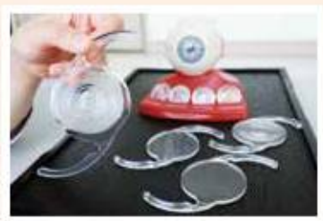
↑ 手術前，應與醫師充分討論。

3. 功能：有無矯正、散光或老花，加強看近還是中距離，包括雙焦／多焦／全焦／三焦各種非球面人工水晶體。